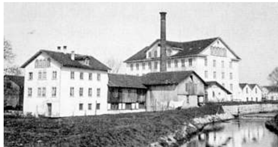
Uster: Spinnerei Bachmann um 1900 (aus: Uster, vom Fabrikdorf zur Stadt, S. 178).

Diese Entwicklung zeigt, dass der damals für viele unverständliche Verlust des ersten Konsums mit einer aussergewöhnlichen architektonischen Leistung wieder wettgemacht wurde.