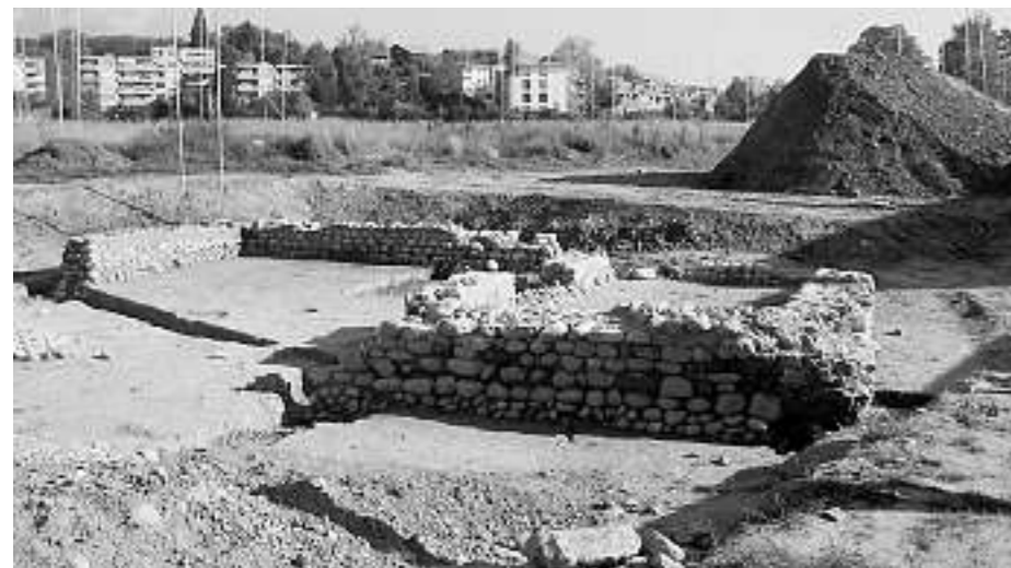
Römischer Gutshof Wetzikon-Kempten, Ausgrabung.

Gärten aus vergangenen Zeiten sind Denkmäler und Teil unserer Kultur, sie sind sichtbare Zeugnisse der Vergangenheit. Es ist einleuchtend, dass grosse und prachtvoll gestaltete Gärten von bekannten Gartenkünstlern als eigentliche Denkmäler gelten. Dass aber auch die kleinen, meist unbeachteten Vorgärten schätzenswerte Zeugen sein können, ist vielen nicht bewusst, und damit ist ihr schleicher Verlust vorprogrammiert. In den letzten Jahrzehnten wurden diese das Strassenbild so prägenden Gärten immer mehr umgestaltet, verschmälert oder gar vollständig abgebrochen. Von diesem Schicksal blieben auch die bäuerlichen Vorgärten der Oberländer Flarzhäuser oder der Kosthäuser nicht verschont.