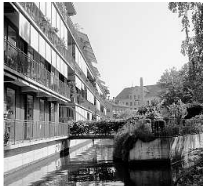
Uster: Wohnüberbauung Im Lot mit ehemaligem Spinnereigebäude (Foto: ryffel+ryffel, Landschaftsarchitekten).