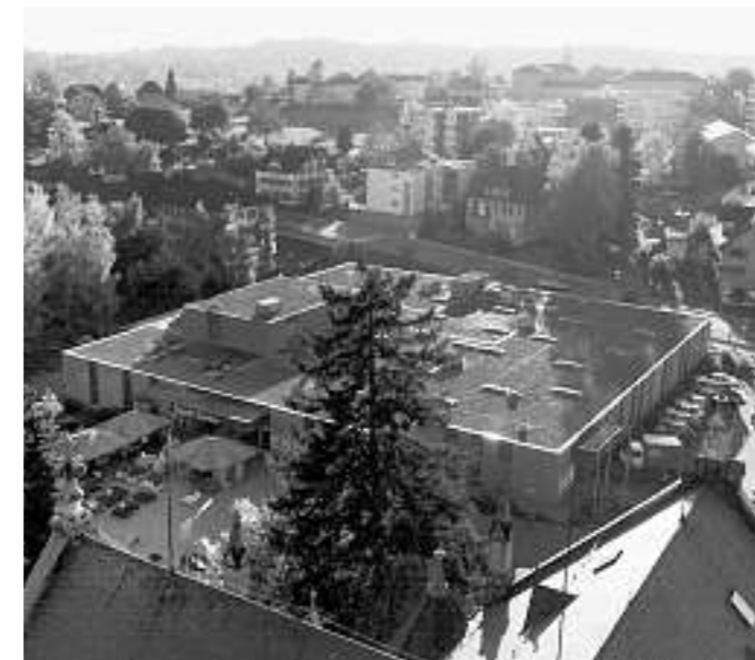
Wetzikon: Der Coop-Neubau von 2002 stellt eine gute architektonische und städtebauliche Lösung dar.