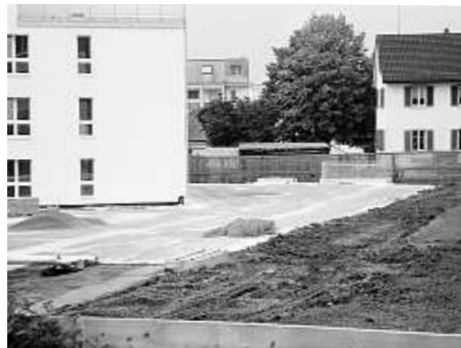
Überbauung Römerfeld in Wetzikon-Kempten (Foto Kulturdetektive GmbH, 2008).