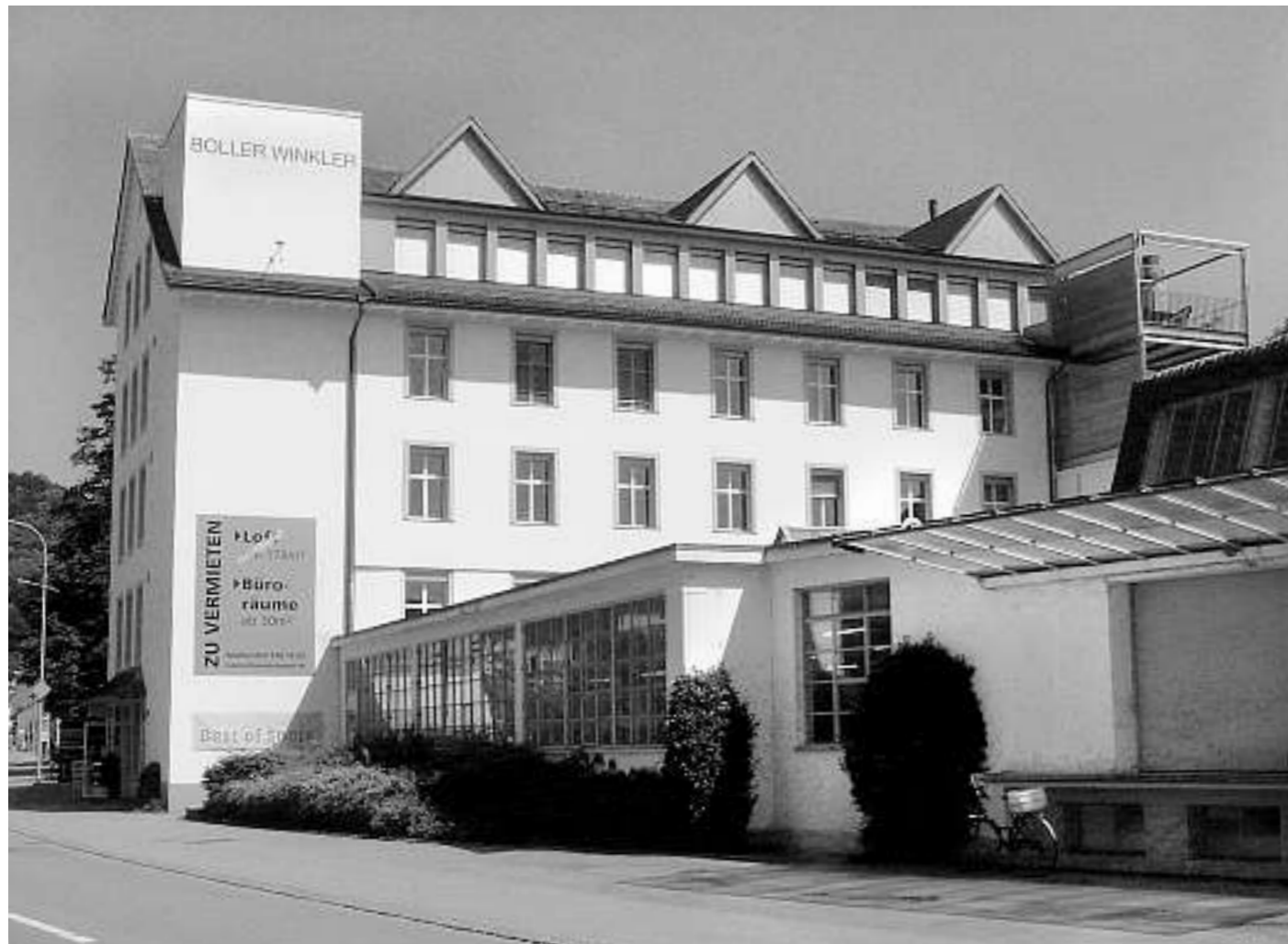
Umnutzung einer ehemaligen Fabrik in Turbenthal.

Der Mensch entwickelte in Jahrtausenden immer wieder unterschiedliche Lebensformen, beeinflusste damit seine Umgebung und hinterliess auch in unserer Region Spuren, die heute noch ablesbar sind. Sie reichen von den prähistorischen Seeufersiedlungen am Pfäffiker- und Greifensee über römische Gutshöfe, wie diejenigen in Pfäffikon-Irgenhausen, und Flarzhäuser bis zu den Zeugen der Industrialisierung. Vor allem mit den industriellen Erwerbsmöglichkeiten verlor das traditionell Bäuerliche immer mehr an Bedeutung. Neben den Wohnformen betraf dies stark auch die Ernährungsgewohnheiten.