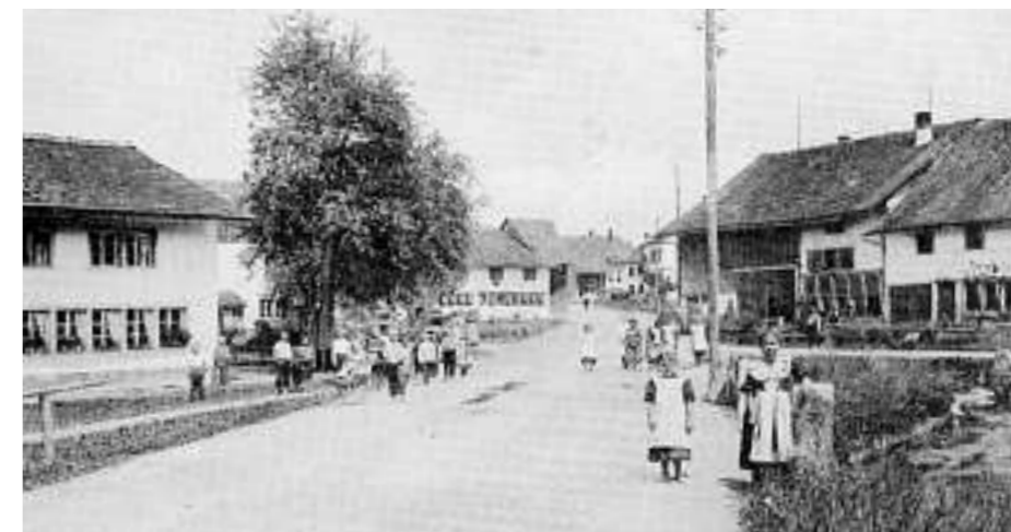
Flarzreihe in Riedikon um 1900. Die bäuerlichen Gärten prägen das Strassenbild (aus: Baumwollgarn als Schicksalsfaden, S. 42).

Schon immer schmückten Blumen und Ziersträucher die Randbereiche der Nutzgärten. Die Freude am Schönen hat somit die Gartenkulturgeschichte von Anfang an begleitet. Alle wesentlichen Merkmale, die die Gartenkultur im Verlaufe ihrer langen Geschichte ausgebildet hat, lassen sich auf die Wurzeln zurückführen, die bis in die Vor- und Frühgeschichte zurückreichen: Ein Garten ist ein geschütztes Stück Boden, auf dem Gewächse mit besonderer Sorgfalt gepflegt werden – sei es, um aus ihnen Nutzen zu ziehen, oder sei es ausschliesslich zu ästhetischen Zwecken.