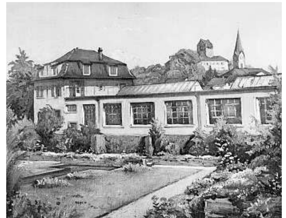
Uster: Fabrikgebäude und Wohnhaus Eduard Ifanger, Forchstrasse 4-6, Gartenseite zum Aabach (Ölgemälde von R. Keller, Uster).

Paul Kläui, Geschichte der Gemeinde Uster, Uster 1964. HP Bärtschi et al., Die industrielle Revolution im Zürcher Oberland, Wetzikon 1985. Reto Jäger, Max Lemmenmeier, August Rohr, Peter Wiher, Baumwollgarn als Schicksalsfaden, Zürich 1986. Martin Schmidt et al., 100.000 Jahre Esskultur: Essen und Trinken von der Steinzeit bis zu den Römern, Hanau 1992. Günther und Rose Leps, Historische Berufsbilder, Der Gärtner, Leipzig 1994. Beat Frei, Die Bauernhäuser des Kantons Zürich, Band 2, 2002.