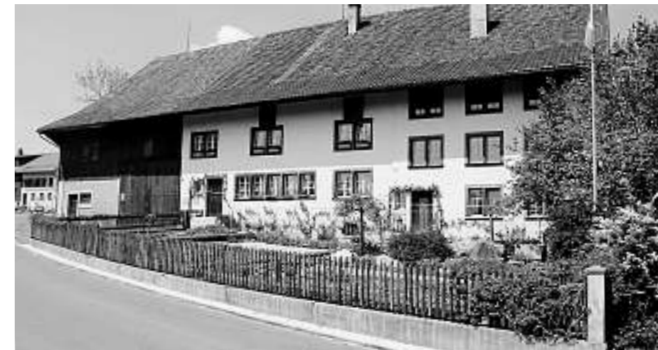
Ottenhausen: Ein noch erhaltener bäuerlicher Garten, der wesentlich zum Erscheinungsbild des Hauses und der Strasse beiträgt.