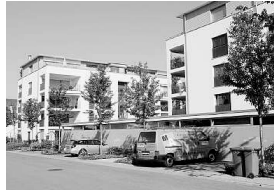
Uster: Wohnüberbauung Forchstrasse, ehemaliger Standort Fabrik Eduard Ifanger (Foto: ryffel + ryffel, Landschaftsarchitekten).

Thomas Specker: Kulturlandschaftsentwicklung im Zürcher Oberland, Spaziergänge in die Geschichte – die Landschaft als Archiv lesen und im Archiv die Geschichte der Landschaft finden. Heimatspiegel 2/2003. Michael Köhler, Uster, vom Fabrikdorf zur Stadt, Uster 2005. Tanja Zerl, Christoph Herbig, Astrid Schweizer, Eine bäuerliche Landwirtschaft mit Feldbau und Viehzucht. Bauern schaffen die erste Kulturlandschaft, in: Die Bandkeramiker. Erste Steinzeitbauern in Deutschland, Hrsg. Jens Lüning, Rahden 2005, S. 37-43. Eeva und Ulrich Ruoff, Zeit für Gärten, Zürich 2007.