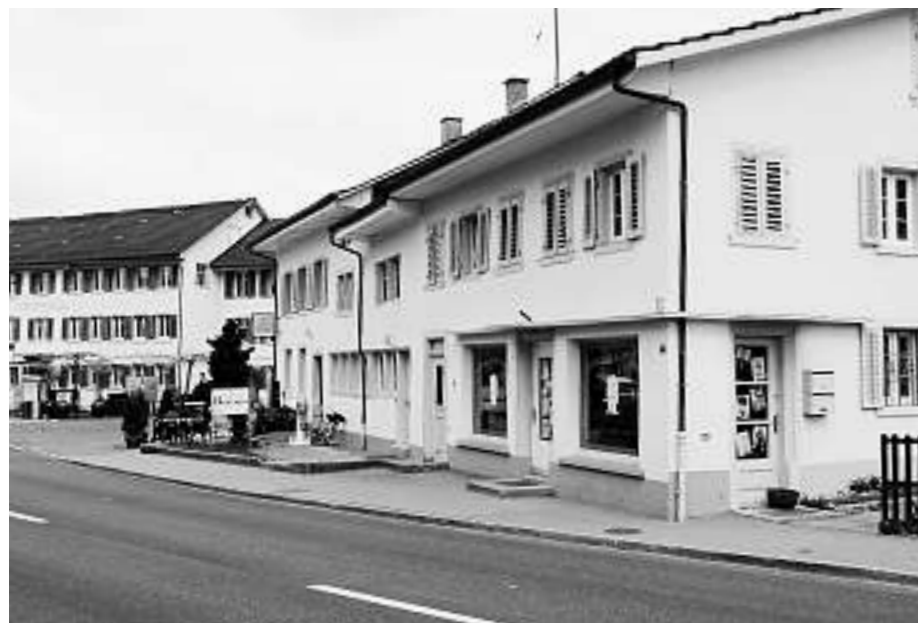
Wetzikon: Der Flarz an der Tösstalstrasse in Kempton ist eines der ältesten Bauernhäuser im ganzen Zürcher Oberland. Das Bild zeigt zwar noch einen Garten vor dem Haus, doch entspricht dieser in keiner Art und Weise dem ursprünglichen Charakter des Hauses und ist dem Denkmal abträglich.

Die typische Hausform im Zürcher Oberland ist der Flarz, eine Art «bäuerliches Reihenhaus». Das Wort «Flarz» stammt von «umeflarze» und hat die alte mundartliche Bedeutung «kriechen, sich ducken», ein sicher passender Ausdruck für die niedrigen Häuser mit den schwach geneigten Dächern. Flarzbauten sind durch Teile, Um- und Anbauten von bestehenden traditionellen Bauernhäusern entstanden. Zu ersten Hausteilungen kam es bereits im 16. Jahrhundert. Anlass dafür war die sogenannte Gerechtigkeitsbeschränkung auf der Allmend.